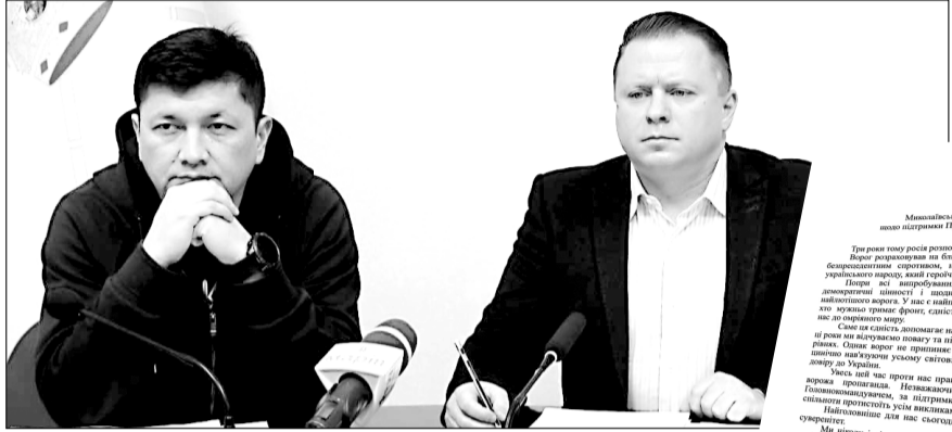
Діяння до рішення облради 25 лютого року №1