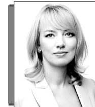
Олена ШУЛЯК, голова партії «Слуга Народу», нардеп

ініціативи очільниці партії Олени Шуляк, стабільно й системно спрямовує кошти для зміцнення Сил оборони України. «Слуга Народу» відмовилася від неперіоритетних напрямів, що дало змогу економити значні суми коштів», - говорять у партії.