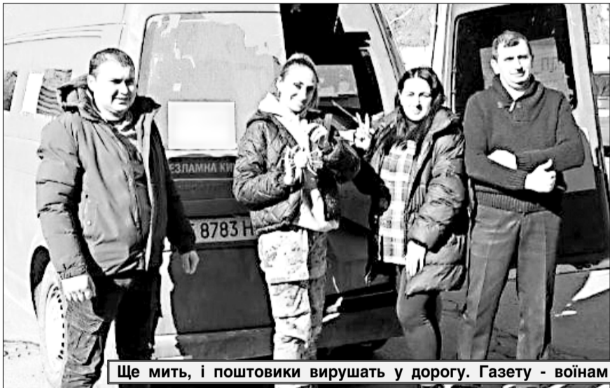
Ще мить, і поштовики вирушать у дорогу. Газету - воїнам