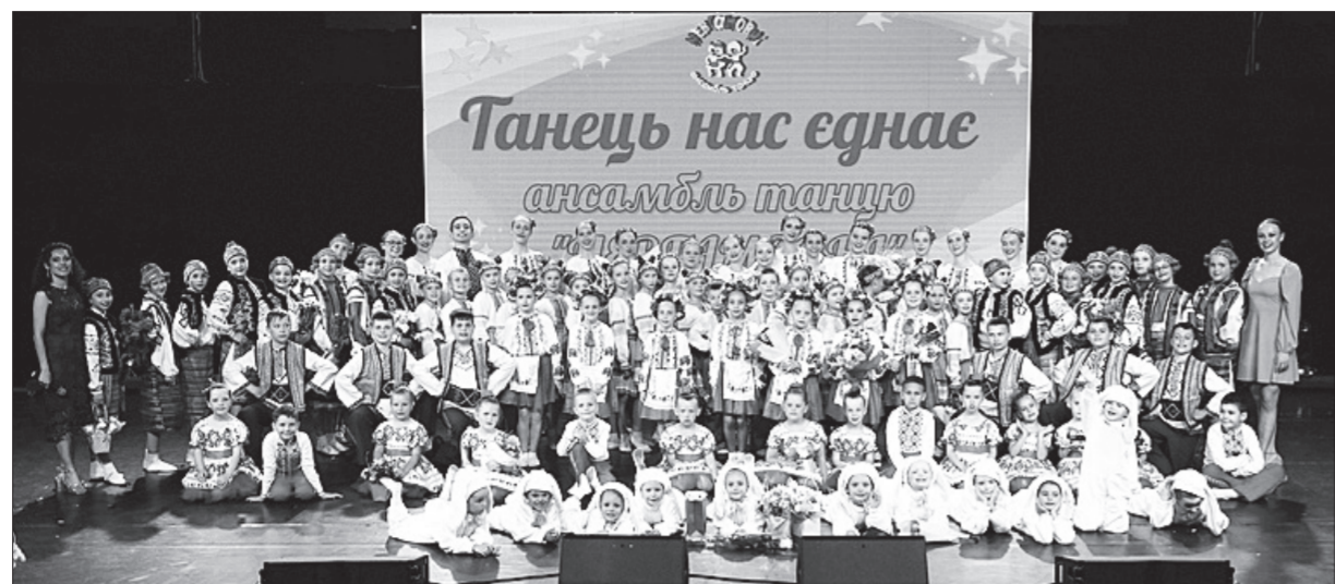
Після звільнення Херсона діти почали повертатися додому, в Миколаїв. Поступово відновилися очні заняття, наповнені новим змістом і ще більшою цінністю кожної зустрічі.

Навіть у найскладніші часи дітям життєво необхідно мати можливість виходити на сцену: проживати, осмислювати й виплескувати свої емоції через танець. Саме сцена стала для вихованців ансамблю «Невгамовні» простором внутрішнього відновлення і сили.