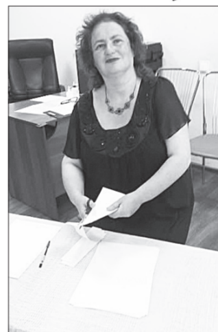
Питання підготувала Тетяна Макаронова.

но з аналогічним українським прислів'ям? 4. Мисливець хвалить вечір, а рибалка його. Хвалить він загаданий у назві картини Сурикова? 5. Він написав безліч есеїв, п'єс та романів, але слава його дитячих книжок, які він присвятив синові, затьмарила його інші твори. Хто він? Відповіді на питання з минулого номера: 1. Мафія; 2. Графологі; 3. Чорна кішка; 4. Чотири президенти США, голови яких висічені на горі Рашмор; 5. Сіракузи.