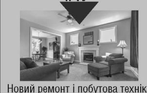
Новий ремонт і побутова техніка

Ви отримали число 124? Обирайте, як використасте Ваші гроші, якщо отримаєте подарунок