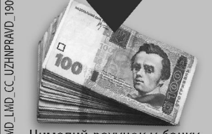
Чималий рахунок у банку