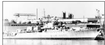
«Миколаїв», ювілейне тисячне судно Миколаєва.

27 серпня 1888 року народився відомий миколаївський краєзнавець і археолог Феодосій Тимофійович Камінський (1888 - 1978) - організатор археологічних розкопок в Ольвії та Спаському урочищі.