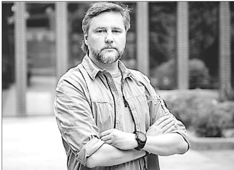
На фото: Родіон Морозов, в.о. голови правління Укргазбанку.

Як Укргазбанк відновлював роботу на звільнених територіях, відповідає на потреби підприємців і розвивав програму «Доступні кредити 5-7-9%» - розповідає Родіон Морозов, в.о. голови правління Укргазбанку.