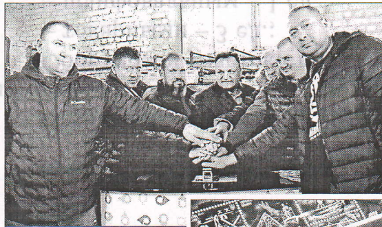
Закінчення. Початок на 1-й стор.

Б лок «Воїни світла. Воїни добра» виконано в темно-синій кольораз, надруковано з використанням двох видів лаку та з застосуванням технології вибіркового лакування. Тут є і особливі акценти - вогники світла, які переміщують темряву. Це перший випуск «Укрпоштою» марок і конвертів, в якому можна побачити малюнок під ультрафіолетом - він світиться. Тираж - 300 тис. примірників. До поштового блоку випущено конверт «Перший день», на якому зображено енергетика, який тримає символічну лампочку, що дає світло на всю Україну. Його загальний тираж - 50 тисяч екземплярів.